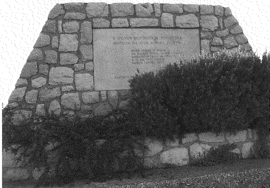
Spomenik u lučici Podurinj koji su nestalim pomorcima podigli mještani Kostrene Sv. Barbare.