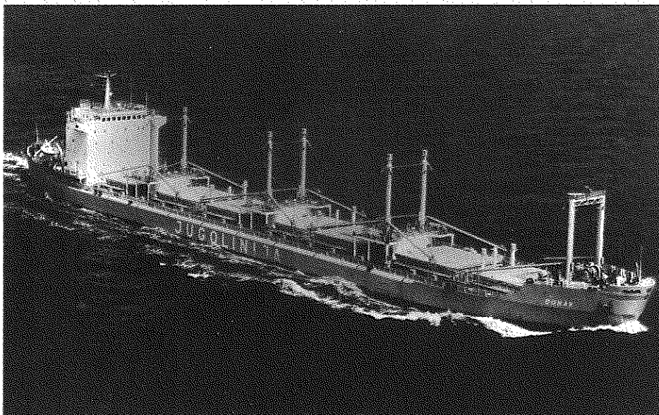
M/b Dunav, Jugolinija Rijeka